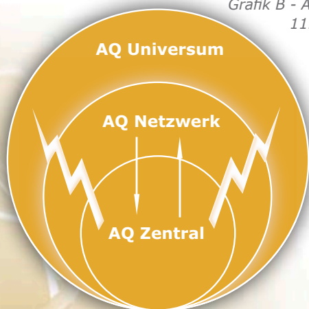
Grafik B - Al-Qaida nach dem 11. September 2001

Nachfolgende Grafik soll verdeutlichen, was al-Qaida 2.0 nach heutigem Kenntnisstand ist und wie es operiert. Aus der straff geführten Organisation hat sich ein dreischichtiges Konstrukt entwickelt, welches die Handlungsfähigkeit unter den für al-Qaida geltenden Rahmenbedingungen sichern soll.